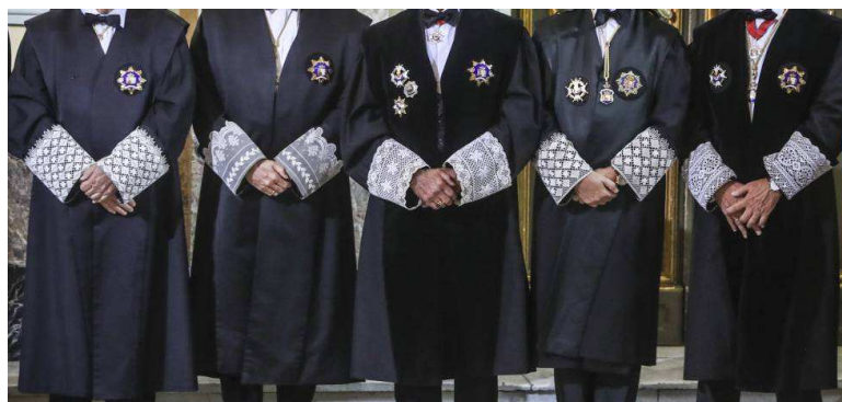
Jueces del Supremo en el acto de apertura del año judicial, el pasado 10 de septiembre