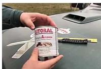
Agentes de la Guardia Civil cuelgan un vídeo en el que bromean... El Periódico Videos