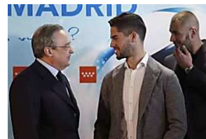
Toque de Florentino Pérez a Isco por culpa del Barcelona Sport.es