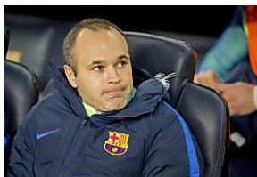
La preocupante revelación de Andrés Iniesta Sport.es