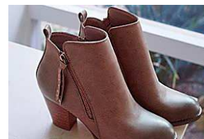
10 preguntas y recibe un par de botines gratis