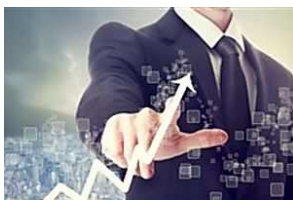
Mejora tu calidad de vida invirtiendo en Trading.