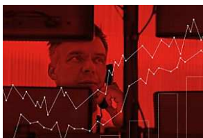
¿Quieres saber lo que pasará con el dólar? Descarga el informe gratis