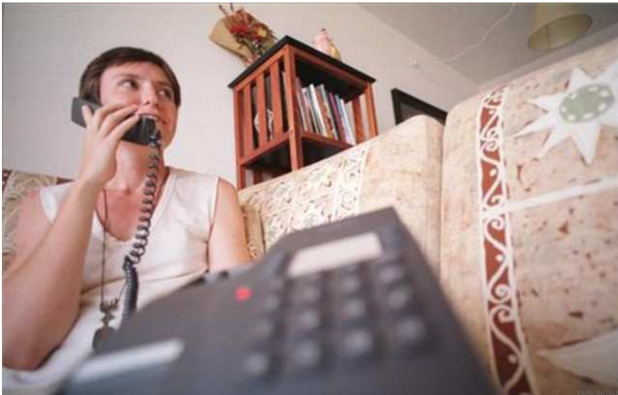
Una mujer llamando por teléfono.