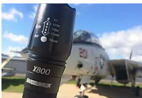
Pronto, todos tendrán una Lumify X9 en casa