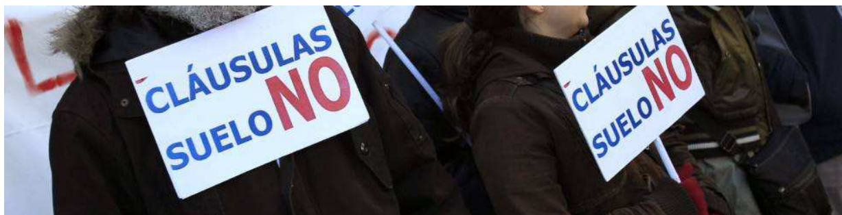
Miembros de la plataforma de afectados por las cláusulas suelo. En vídeo, la reacción de la asociación ADICAE. / EFE / VÍDEO: QUALITY

La banca llevaba meses en vilo, a la espera de saber si tenía que devolver el dinero de las cláusulas suelo desde 2013 ( cuando una sentencia de Supremo las declaró ilegales ) o desde más atrás, desde 2009. La diferencia es enorme: entre 3.000 o 5.000 millones, según diferentes cálculos de los especialistas. El Banco de España estima el sobrecoste en algo más de 4.000 millones; Analistas Financieros Internacionales cree que será algo más, unos 4.500 millones. Solo para las entidades cotizadas, devolver el dinero que estaba en juego les supone una factura de más de 2.000 millones de euros, según los cálculos de EL PAÍS.