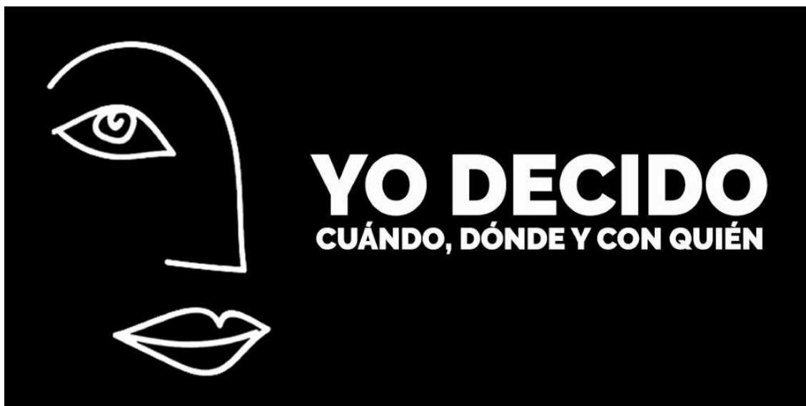
Imagen de la Campaña Nº 1