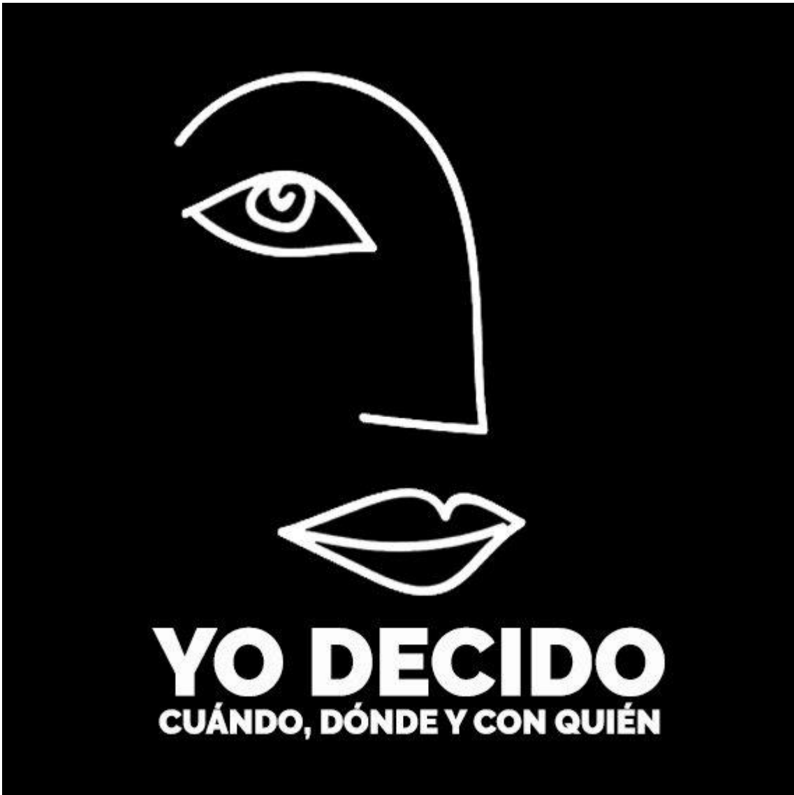
Imagen de la Campaña 6