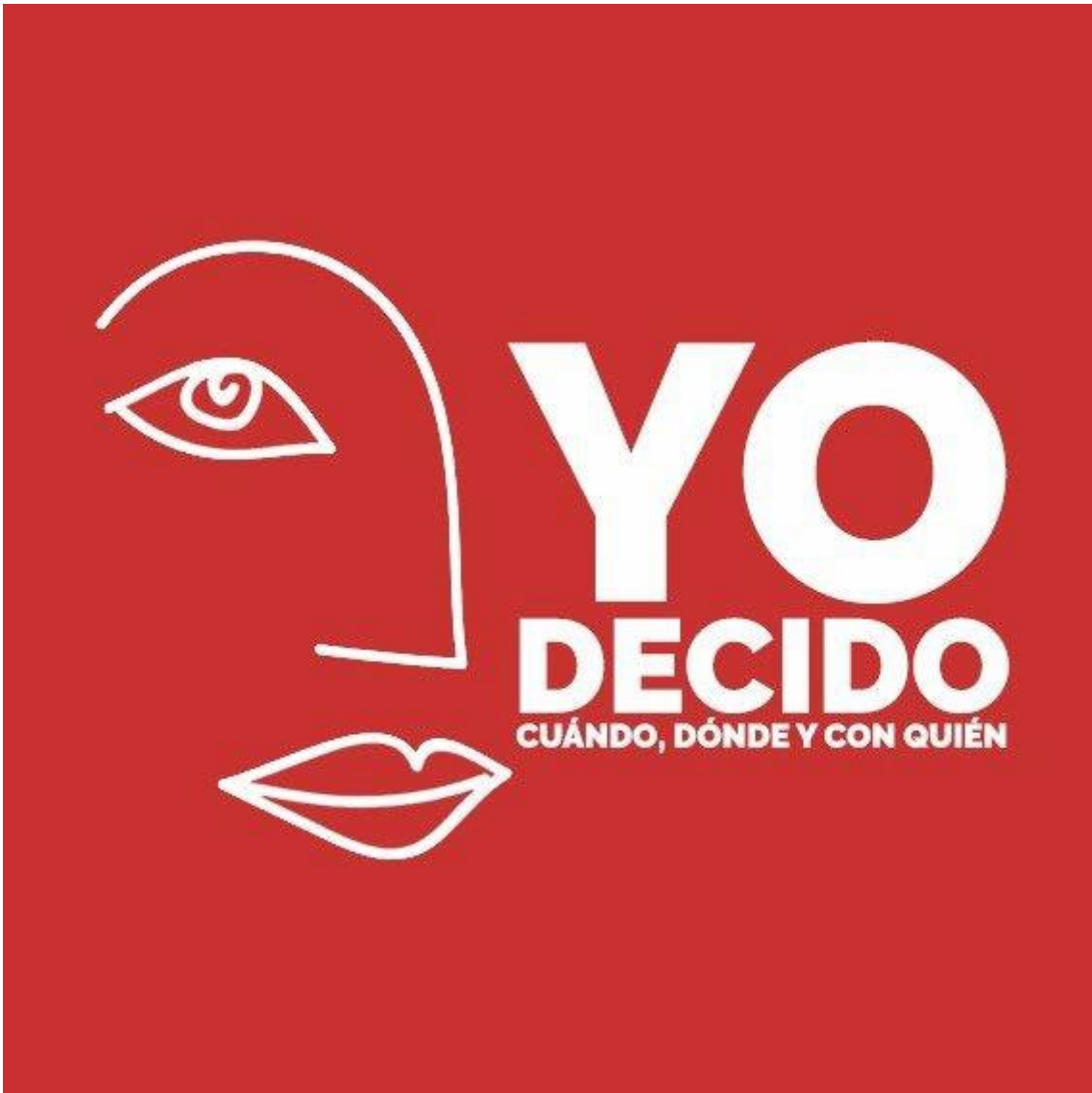
Imagen de la Campaña 2