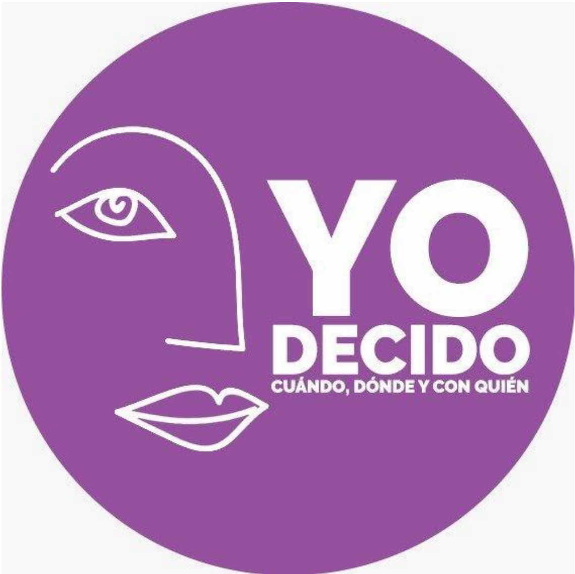
Imagen de la Campaña 8