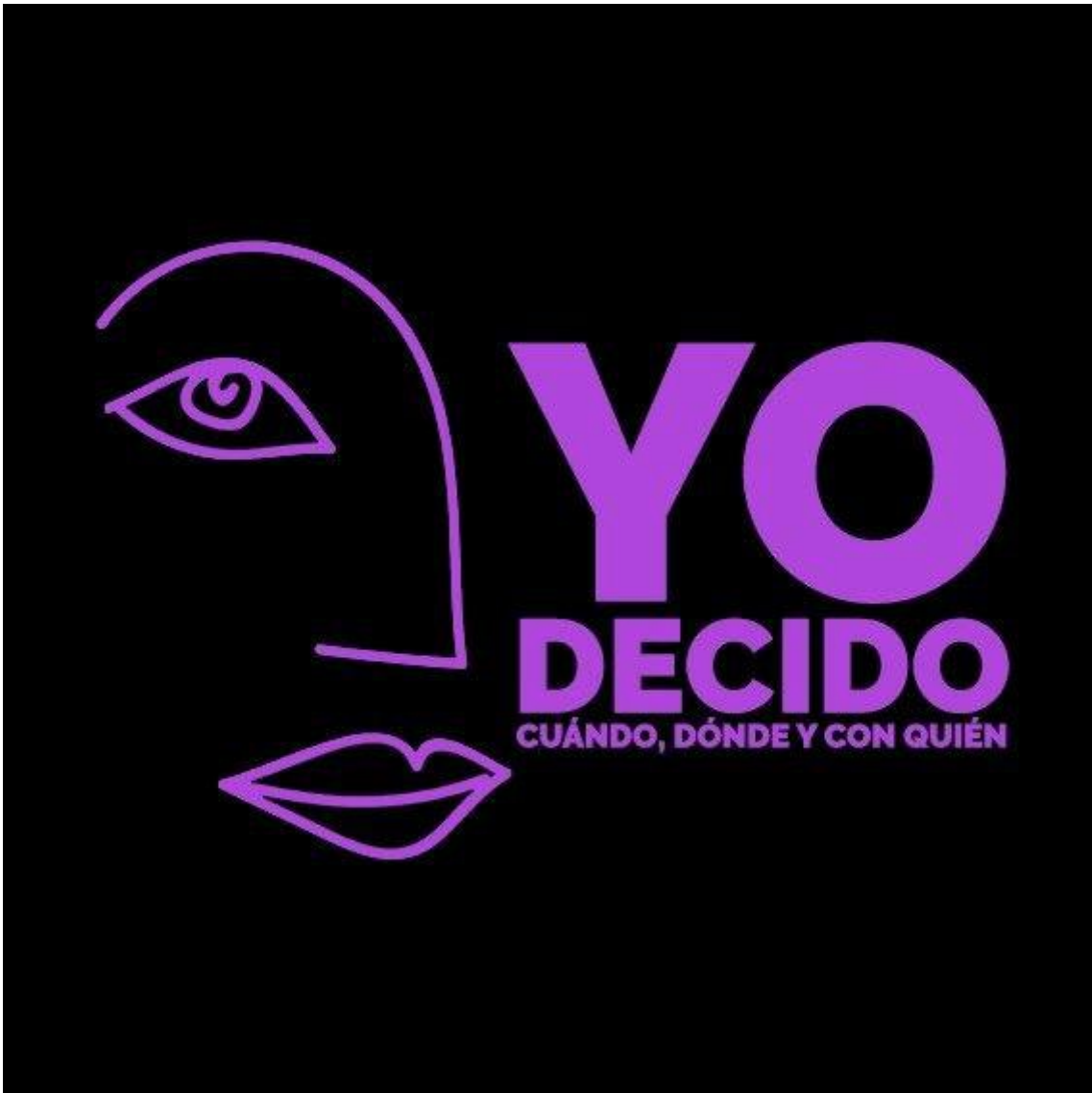
Imagen de la Campaña 4