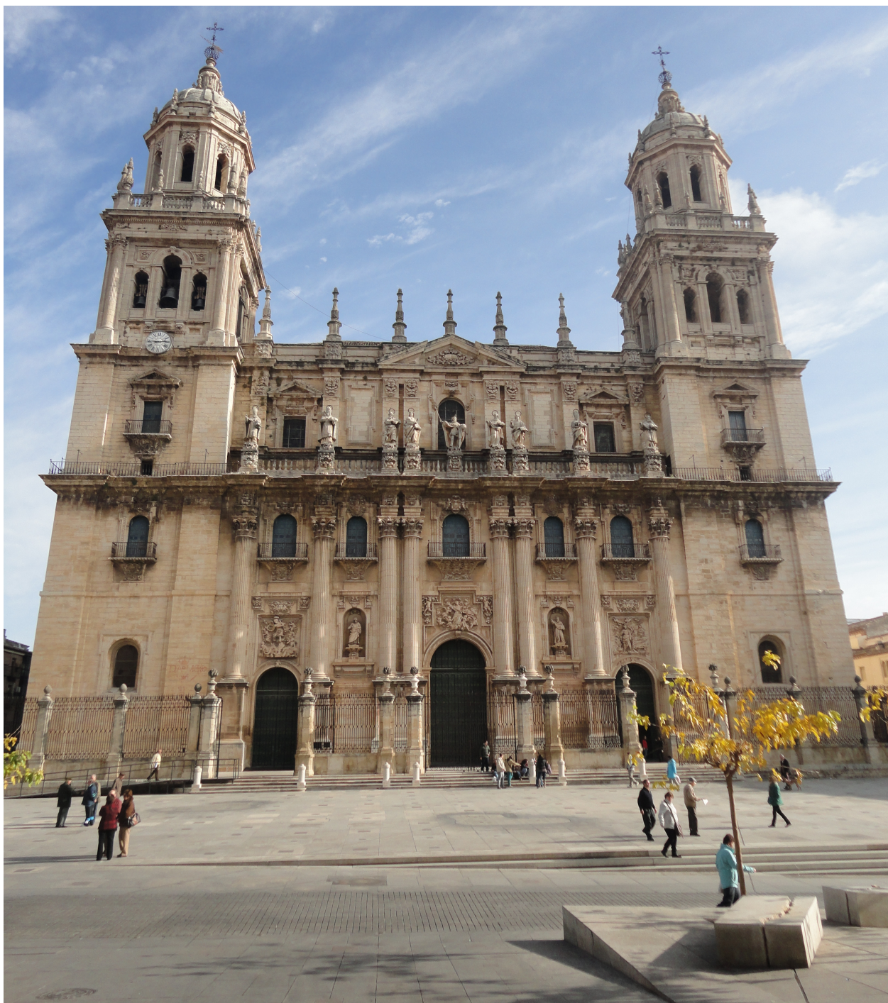
Vista general de la fachada principal de la Catedral de Jaén con las esculturas de Pedro Roldán, s. XVII-XVIII.

Por último, no podemos olvidar que en el interior Roldán también esculpió los bajorrelieves de Huida a Egipto y Jesús entre los Doctores (h. 1675-1681); y diseñó los de La Asunción y el Triunfo de San Miguel (h.1675-1683) de su fachada principal, aunque estos fueron finalizados por su sobrino-nieto Julián Roldán.