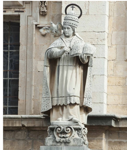
San Agustín y San Gregorio, Padres de la Iglesia

- Mateo el Evangelista (Tercero por la izquierda): La figura, con rasgos de anciano, túnica talar y manto como todos los demás evangelistas, interrumpe su redacción para mirar a sus pies a un ángel niño desnudo que le acerca una pequeña caja (tal vez un tintero). Dicho ángel es su atributo más frecuente y quien, según su leyenda, le dictaba las escrituras.