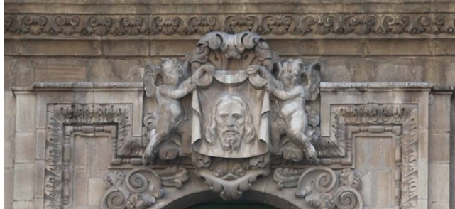
Relieve del Santo Rostro sostenido por ángeles .

Entre estas dos figuras, y sobre la mencionada puerta principal, se sitúa un mediorrelieve del Santo Rostro sostenido por dos ángeles , también obra de Pedro Roldán hacia 1677-1684.