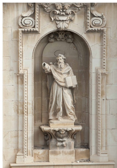
San Pedro y San Pablo