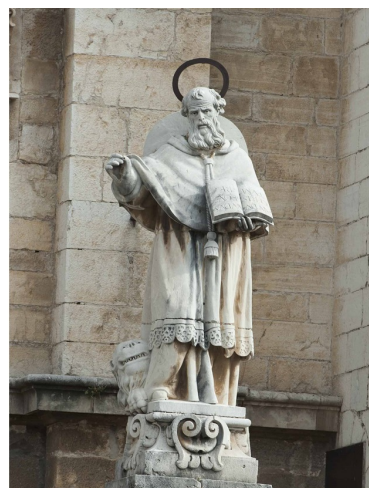
San Ambrosio y San Jerónimo, Padres de la Iglesia