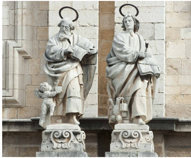
San Mateo y San Juan Evangelistas

- Fernando III de Castilla (Quinto y central): Siguiendo la iconografía creada por Roldán, el santo no se presenta con indumentaria medieval del siglo XIII sino como un anacrónico monarca conquistador de época Moderna: con corona real, cuello de lechuguilla, coraza militar, calzones gregüescos, calzas, mocasines y cubierto con un manto real de armiño. Su mirada es alta y en su mano derecha empuña en alto la legendaria espada Lobera, emblema de su poder real y conquista; mientras que en la izquierda sostiene un globo terráqueo, símbolo del universo cristiano. Además, de su pecho cuelga un medallón con la imagen de la Virgen, probablemente en referencia a la Virgen de los Reyes por la cual, según su leyenda, sentía tal devoción que en su testamento pidió ser enterrado a sus pies.