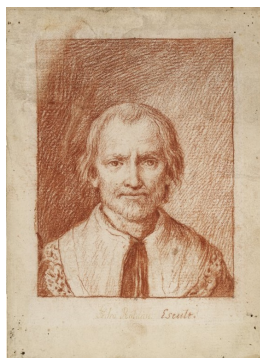
Atribuido a Francisco de Goya. Retrato de Pedro Roldán , h. 1798-1799. Londres. British Museum.

En esta ciudad recibió numerosos encargos, sobre todo de instituciones religiosas, cofradías y parroquias de diferentes provincias: esculturas monumentales y de vestir, retablos, ornamentos, relieves y grupos escultóricos como sus obras maestras El Descendimiento (1666) para la capilla de los Vizcaínos; y el Entierro de Cristo (1670-1672) para el Hospital de la Caridad, ambos en Sevilla. En 1670 el Cabildo Catedralicio de Sevilla le encargó su famosa efigie de San Fernando , con motivo de su esperada canonización en 1671. Este acontecimiento fue crucial para España porque por fin se conseguía que en la corte celestial hubiera un representante de la corona española. Por ello, esta nueva y original iconografía del santo como guerrero aportada por Roldán influyó enormemente en la posterior producción escultórica andaluza. Por aquellas fechas ya era un consagrado y reputado artista en la ciudad, siendo además iniciador de una familia de artistas instruidos por él mismo (tuvo un total de ocho hijos). También fue padre de la reconocida escultora barroca Luisa Roldán, su hija más aventajada y futura renovadora estilística del Barroco español. Roldán murió el 4 de agosto de 1699 y está enterrado en la parroquia de San Marcos de Sevilla. Su huella artística continuó a lo largo de sus herederos, discípulos y seguidores hasta bien entrado el s. XVIII.