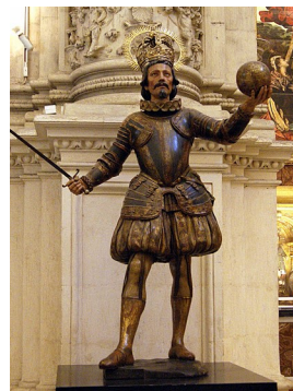
Pedro Roldán. San Fernando , 1671. Sevilla. Sacristía Mayor de la Catedral