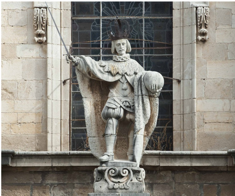
Escultura central de San Fernando

- Fernando III de Castilla (Quinto y central): Siguiendo la iconografía creada por Roldán, el santo no se presenta con indumentaria medieval del siglo XIII sino como un anacrónico monarca conquistador de época Moderna: con corona real, cuello de lechuguilla, coraza militar, calzones gregüescos, calzas, mocasines y cubierto con un manto real de armiño. Su mirada es alta y en su mano derecha empuña en alto la legendaria espada Lobera, emblema de su poder real y conquista; mientras que en la izquierda sostiene un globo terráqueo, símbolo del universo cristiano. Además, de su pecho cuelga un medallón con la imagen de la Virgen, probablemente en referencia a la Virgen de los Reyes por la cual, según su leyenda, sentía tal devoción que en su testamento pidió ser enterrado a sus pies.