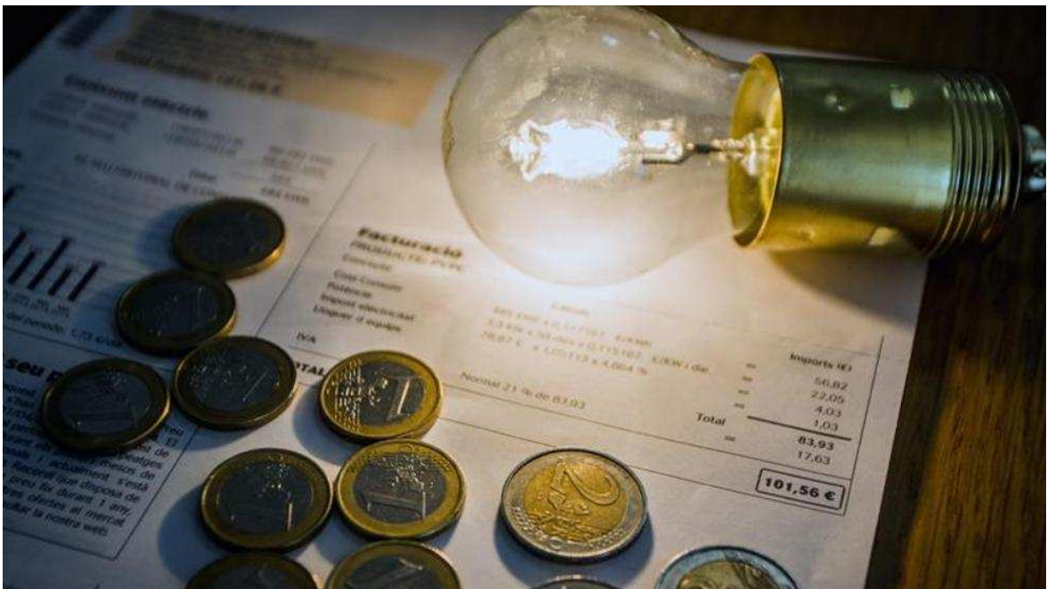
El precio de la luz va al alza (LVE)