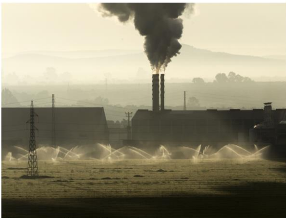
<Amanecer> Floren Fernández Parra 1º premio categoría: Fotodenuncia