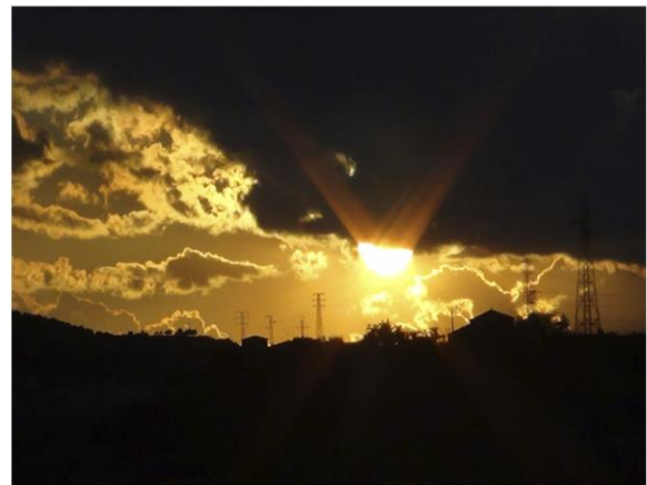
<Postes al atardecer> Lucía Ramírez Pereria 1º premio categoría: Fotodenuncia Juvenil