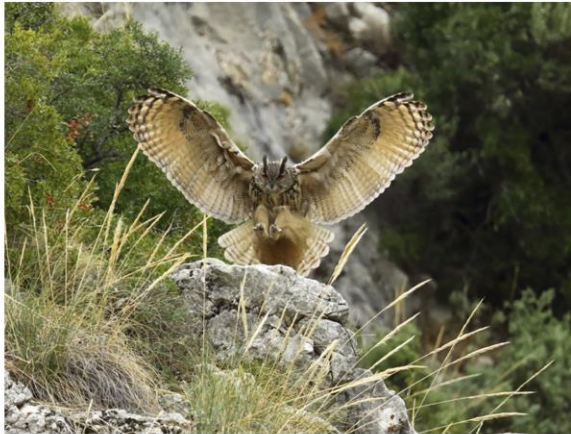
<Buho Sierra Sur> Miguel A. Domínguez Galán 1º premio categoría: Naturaleza