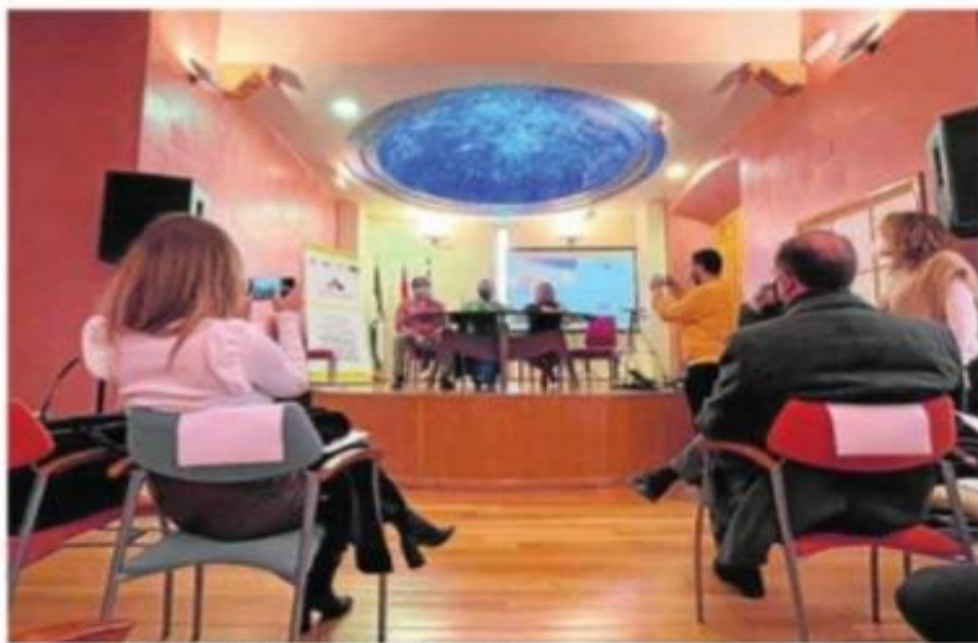
Encuentro celebrado en el Patronato de Asuntos Sociales.

Así, se puso en valor que 700 personas se hayan beneficiado del programa. «Son colectivos que tienen mayores dificultades de incorporación y, si no fuera por estos programas, sería imposible o muy difícil que pudieran